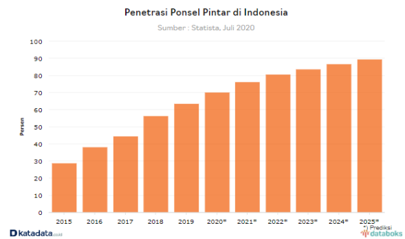
Gambar 2. Penetrasi Ponsel Pintar di Indonesia